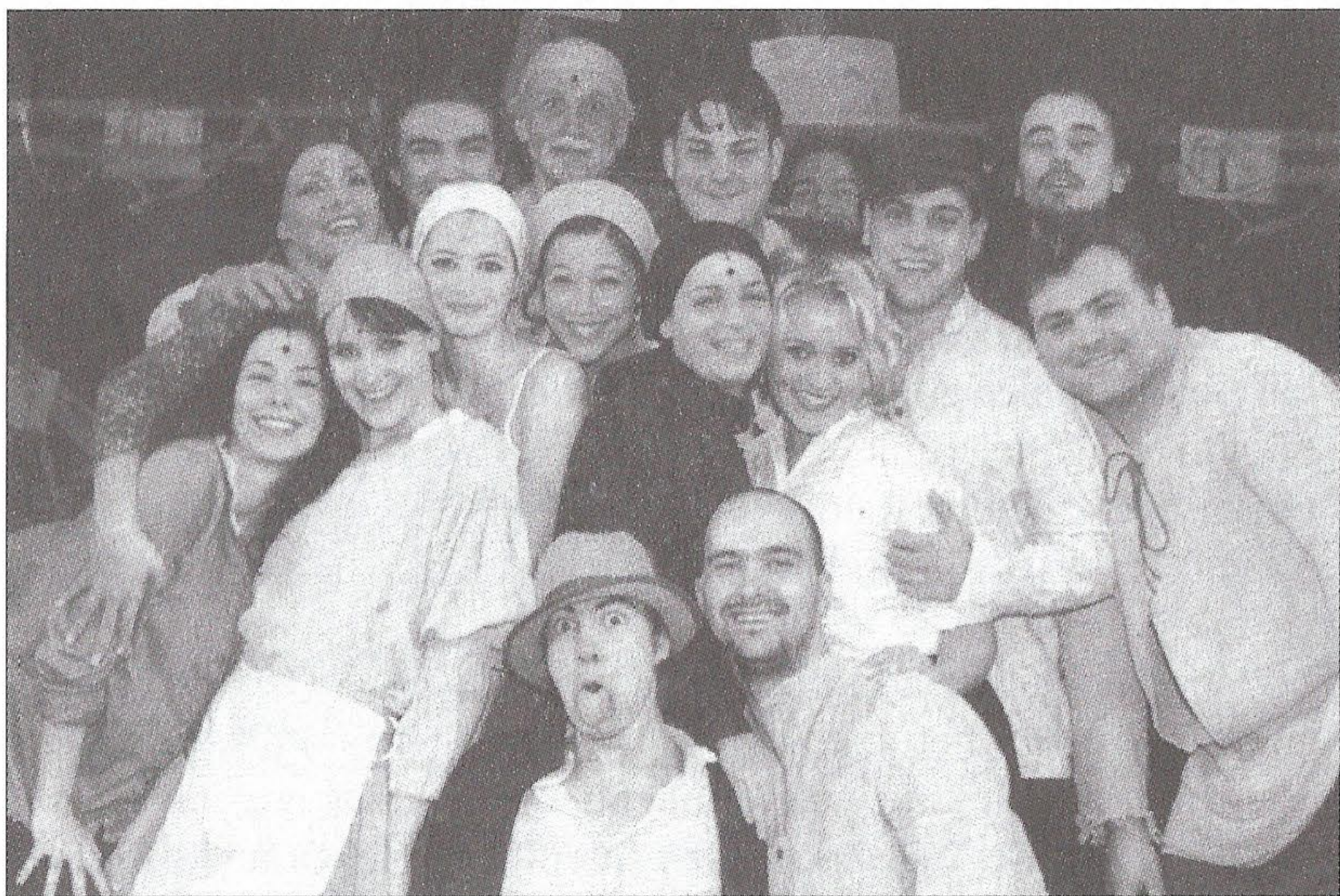
A főiskolai osztály, a Hegedűs a háztetőn c. előadás előtt