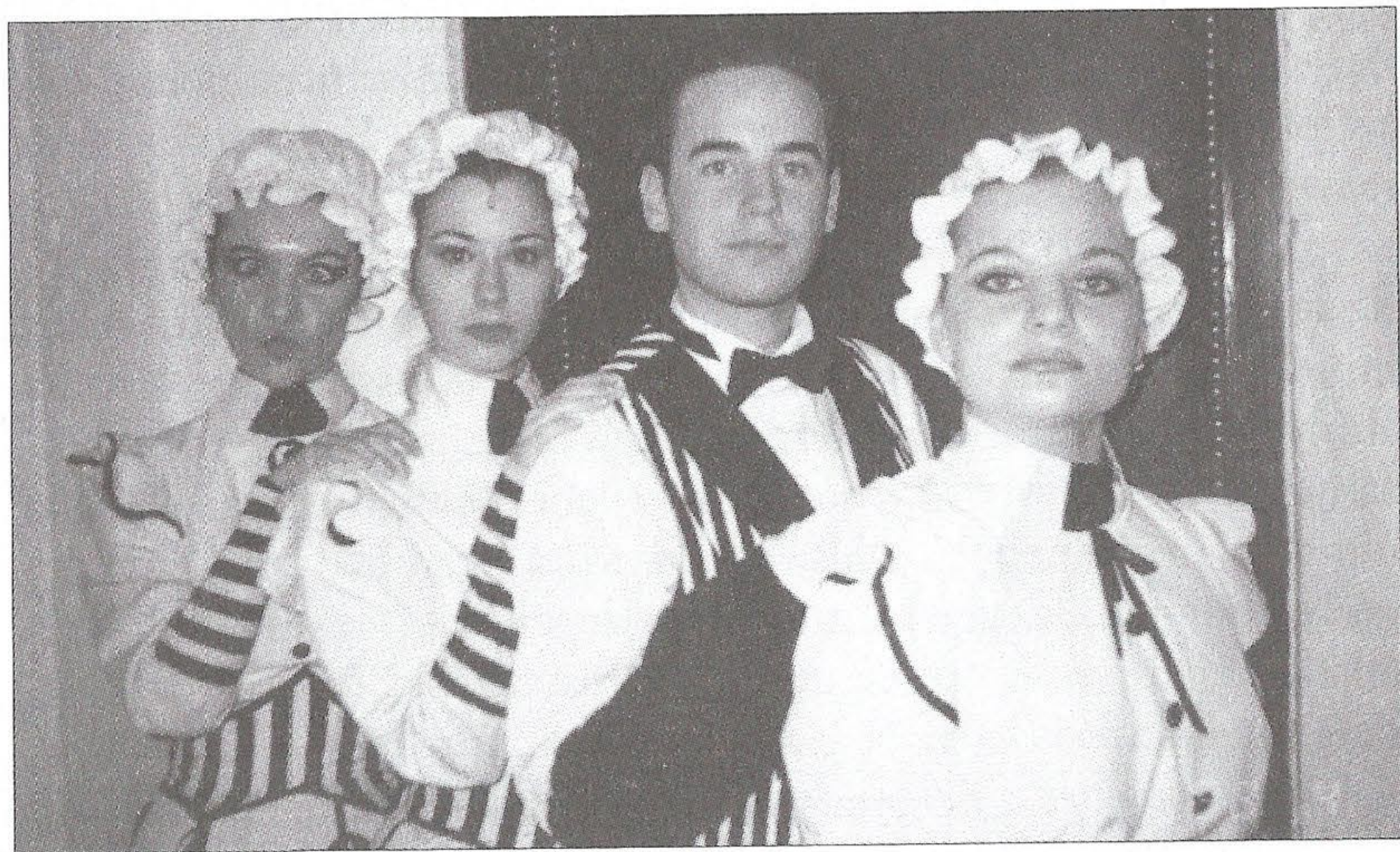
A My Fair Lady előadásban (balról a második)